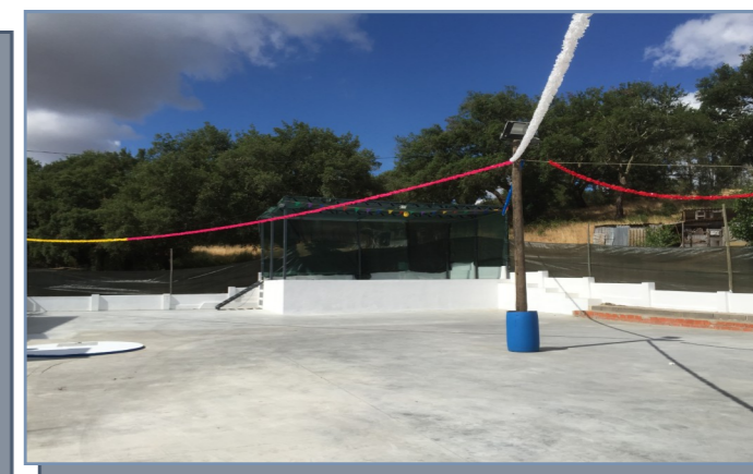
Construção de um palco e cobertura do piso na Escola de Vale de Guizo