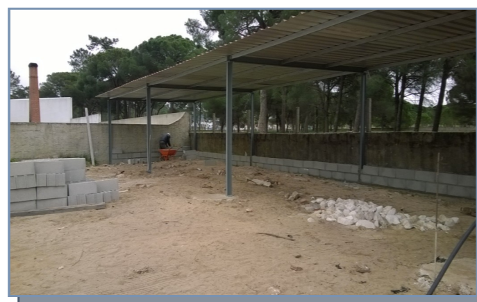
Construção do Estaleiro da União das freguesias de Alcácer do Sal