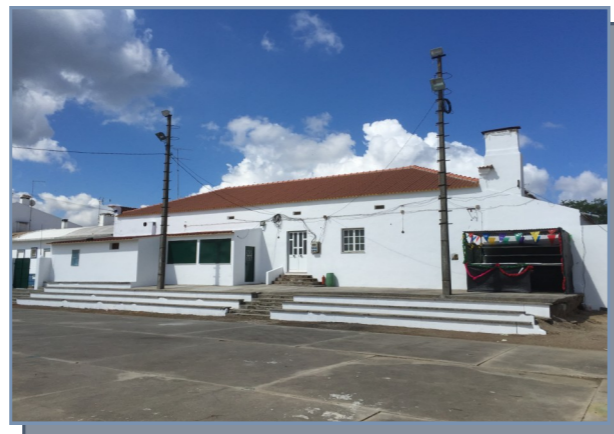
Pinturas na Sede do Grupo Desportivo e Recreativo de Palma