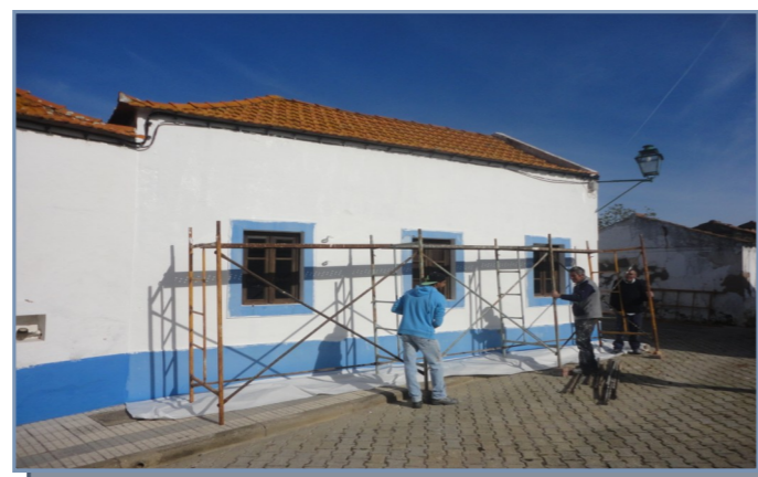
Pinturas em Santa Susana