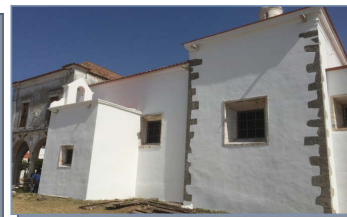
Melhoramentos na cozinha da escola dos Açogues que dá apoio à Universidade Sénior e ATL . Pintura da Igreja dos Frades de Alcácer do Sal