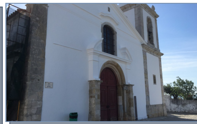
Pinturas na Igreja Matriz de Alcácer do Sal