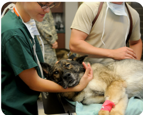
A reprodução de animais deve ser feita com acompanhamento

Diminui a agressividade dos machos, que ficam mais tranquilos.