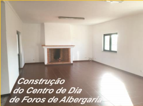
Construção do Centro de Dia de Foros de Albergaria

Uma autarquia de ABRIL ao serviço da população FICHA TÉCNICA Edição e propriedade: União das Freguesias de Alcácer do Sal e Stª. Susana Direção da Publicação: Presidente da Junta de Freguesia da União das Freguesias