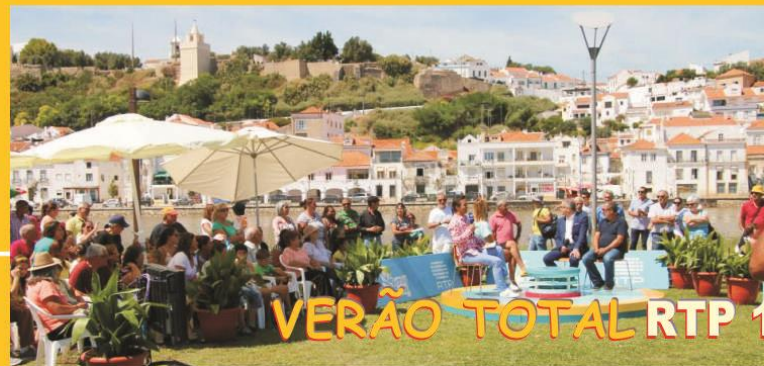
VERÃO TOTAL RTP 1

Uma autarquia de ABRIL ao serviço da população FICHA TÉCNICA Edição e propriedade: União das Freguesias de Alcácer do Sal e Stª. Susana Direção da Publicação: Presidente da Junta de Freguesia da União das Freguesias