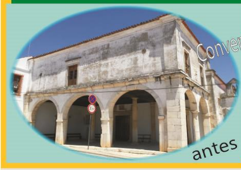
Convento dos Frades