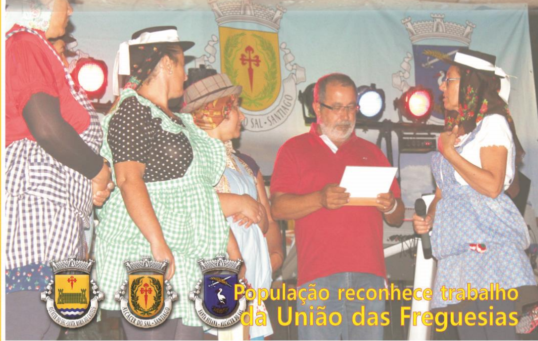
População reconhece trabalho da União das Freguesias

União das Freguesias de Alcácer do Sal tª Maria do Castelo Santiago tª Susana