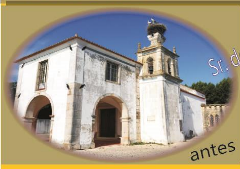
Sr. dos Mártires